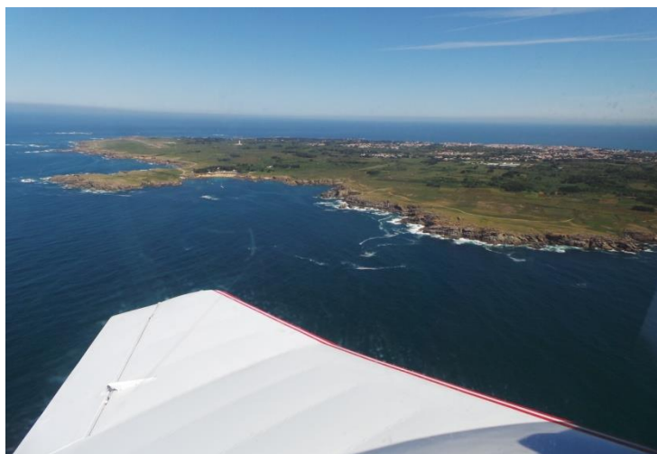
Ile d'Yeu - Tour ATL 2017

Les inscriptions sont à faire avant le 31 mars 2018.